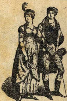
Elegants del 1800

La Revolució operà un canvi radical en la moda; fins les dones volgueren significar per mitjà dels vestits l'adherència a la renovació política: capells a la Bastilla, a la patriòtica; vestits de cotó, ratllats amb els colors nacionals; teles de colors clars, per evocar l'antiguitat grega; suprimint cotilles, enagües, i tot allò que pogués aparentment disfressar la forma natural; donant, així, vida a les meravelloses . Cal-saren coturn, sabates blanques d'alta sola, lligades amb cintes al coll de la cama. Vestien túniques sense cenyir o cenyides sota mateix del pit, obertes d'un costat per mostrar la cama coberta d'un colant de seda del color de la pell. Tan lluny anaren per aquest camí, que fou precis posar-hi aturador. Un altre corrent de gent més sensata i partidària de les modes angleses, encarrilaren la cosa amb millor sentit de les conveniències socials. Aleshores s'establí l'ús del xal, que tanta fama adquirí.