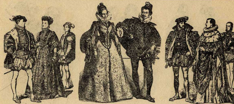
Francesc II i sa filla Parella espanyola, s. xvi Antoni de Borbó i Carles IX

En el segle XII les senyores duïen el cabell partit en dues mates per la clenxa i trenades amb cordons de seda i fil d'or o enfilalls de perles, cenyit al front amb un cercol de metall que sostenia el vel. Al XIII, les trenes passen de moda, en particular per les donzelles, que deixaven el cabell lliure penjant a l'esquena. Les dames feren, a mena d'estofes o grans bufes als costats per sobre l'orella i damunt de cercols de metall, corones de flors o lligams d'estofes precioses, cobert de benes de lli finíssim que donaven la volta, passant per sota la barba, i d'allà a les bufes. Això substituï la guimpa, que sols