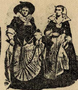
Flamenques, s. XVII