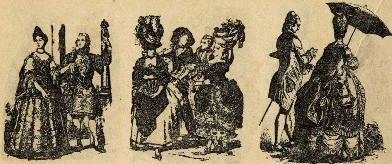
Dama i guarda (Lluís XV)