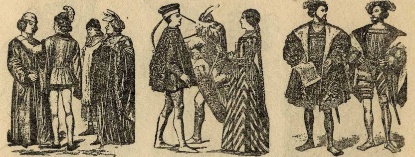
Francesos del 1470

En temps de Carles VIII, a França, es notà una reacció contra la senzillesa en el vestir imposada per Lluís XI. Les calces amb camall de diferent color, es deixaren per al servei. Els patges de Lluís XII les duïen vermelles i grogues; els d'Anna de Bretanya les usaren grogues i negres; l'heraut d'Alfons V d'Aragó, les dugué blanques. Aquestes calces pels patges de les corts, són vistes ja molt anteriorment en unes miniatures de les Càntiques a Santa Maria , d'Alfons X, en les que s'hi veuen representats els de les corts de Castella i Aragó a últims del segle XIII.