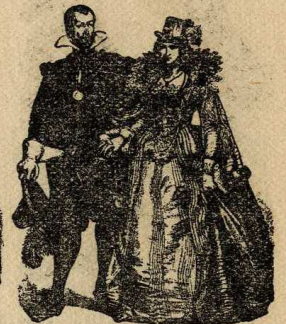
Parella hispano-flamenca, XVII

ven en punta, sinó en cònus trencat. La moda durà de 1430 a 1470.