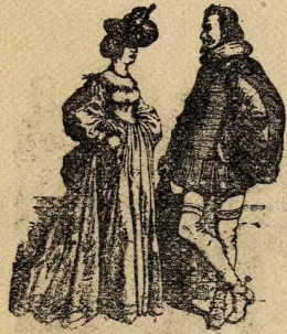
Dama noble i Enric IV