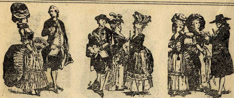
Dama i cavaller (1780)