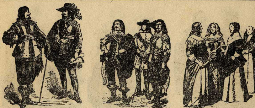
Habillaments de cavallers i dames de mitjans del s. XVII

com una curta mantellina o caputxa oberta per darrera, sostinguda sobre la testa per agulles capsades d'or i pedreria. El templet era d'escarlata* per la classe mitja, i de vellut pel senyoriu. Homes i dones usaven, entre diverses bagues, una per segellar documents.