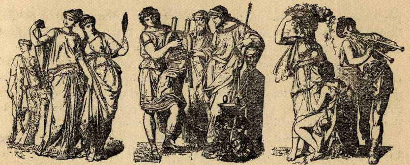
Dames gregues Poeta, sacerdot de Bacus i rei grecs Camperols grecs

A més de la toga, s'usaven altres mantells: la pènula, una espècie de ponx amb un trauc central per passar la testa; la lacerna, capa tancada per guardar-se de la pluja, amb caputxó; el sagun