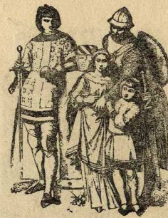
Habillaments del s. XIII

i fent de visera la del davant. Aleshores es comensà a exornar-los amb plomes d'austruc o paó.