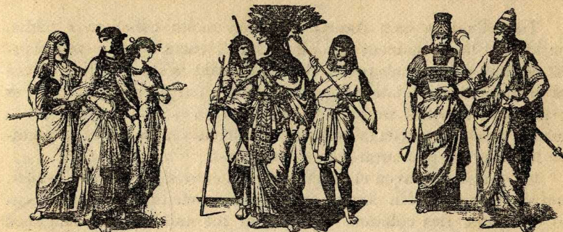
Reina i dames egípcies

Com vestia Assonibasipal, l'orgullós vencedor d'homes i lleons, ho podem col·legir pels relleus, si bé els notables escultors d'aitals