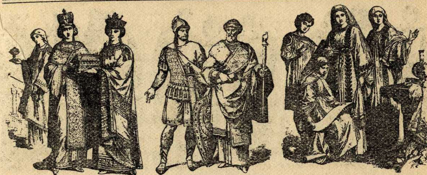
Emperadriu i princesa

Els brians tenien a un costat del pit una incisió amb tapeta ornada de galons, mànegues curtes o llargues; i davant i darrera una obertura del faldó, per a poder-hi cavalcar, cenyida al cos pel cinturó. La camisa, que era llarga, també era oberta per la mateixa raó; els pagesos i classe treballadora se la retrossaven sota el cinturó per al treball, com es veu en les figures de la portada del monestir de Ripoll. Predominava la clàmide, com mantell cordat a l'espatlla dreta. A la capa pluvial el segle XII li feren obertures laterals per treure els brassos, però a voltes s'hi afegiren mànegues prenent el nom de balandran .