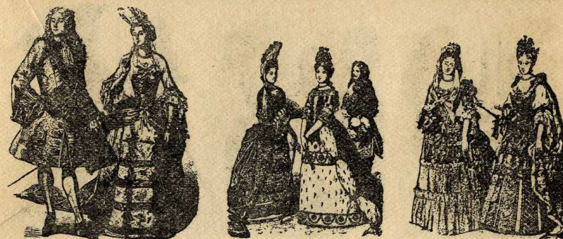
Parella del comens xviii

Durant gran part del llarg reinat estigueren en predicament les llassades sobre les espatlles, formant xarretes, i en les calces, com duïen els elegants. Després, quan una llei restrictiva prohibí els galons d'or i argent en els vestits, les llassades i blondes foren el luxe, apart dels brocats i sedes recamades. La forma del ruingrave, aquelles