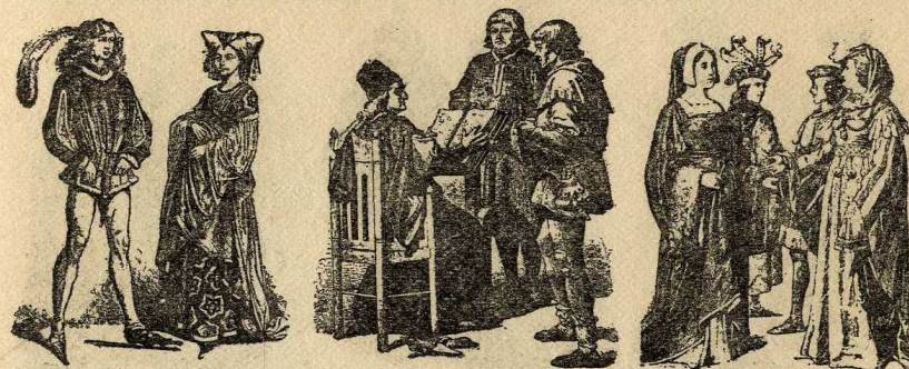
Habillaments francesos, XV Jutge, burgès i ciutadà, XV Nobles francesos, 1460-1480

Les modes del segle XV foren tan arbitràries com les de la segona meitat de l'anterior. Les corts de França i Borgonya donaven el to. Els vestits curts en extrem foren fantasies, però no ho foren menys els llargs en desmasia. El luxe i la riquesa en engalanar-los