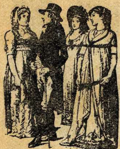
Altres habillaments d'últims del segle XVIII