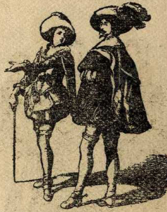
Franceses del s. XVII

per guardar-se dels freds i el mal temps. Els capirons eren folrats de pell a l'hivern, i de seda a l'istiu.