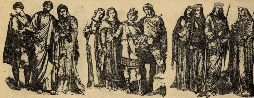
Cristians del s. iv al vi