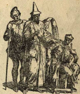
Ciudadà, jueu i cavaller, s. XII

no eren sempre de lli o tela. Es feien també de pell, per ésser més resistents i, per tant, de més durada. En aquest últim cas, eren curtes. Les de tela arribaven al tornell; entre el poble, que no usava mitges, es cordaven amb una veina a la cintura. En les senyorells penjaven cordons per mantenir tivants les mitges. No eren encara aquestes de punt, sinó d'estofes de colors, tallades a mida perquè ajustessin bé, essent encarregada als sastres mitgers la confecció.