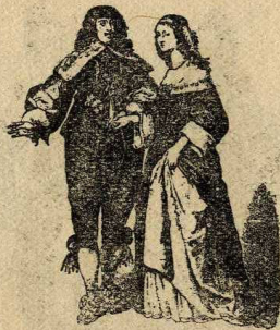
Lluís XIII i la reina