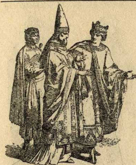
Criat, bisbe i rei, s. XII