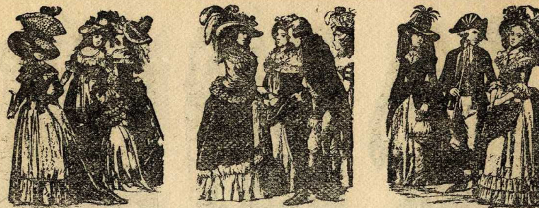
Modes masculina i femenina de finals del segle XVIII

de davant, i les recollien del costat per mostrar les interiors. Duien ròssec més o menys llarg amb relació a la categoria social.