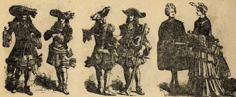
Oficials i mosqueter de la guarda; Abbé i dama francesos (Lluís XIV, finals segle xvii)

El tabart o dalmàtica, uniforme dels mosqueters, prengué el nom de casaca. Era blava, amb una creu d'or i sutaixos blancs, sobre el pit, esquena i espatlles. Quan es deia mosqueters grisos o negres, obeïa al pel o color dels cavalls de cada companyia, no a què vestissin de negre o gris. L'uniforme consistia en l'armament, la capa o pèl dels cavalls i en la vesta i montura. La resta era a gust del consumidor, en temps de Lluís XIII.