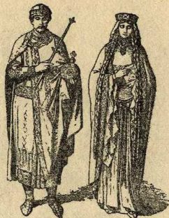
Reis francesos, s. XI