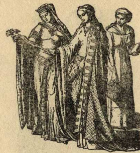
Dames alemanyes, s. XII