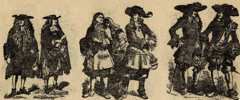
Cònsol i senador, 1670

Enric IV, rei de Navarra, al pujar al soli francès, féu fer altre girada a la moda amb uns costums més varonils i senzills. Se suprimiren les botargues en els gipons, la trusa tornà a ésser llarga i mit-