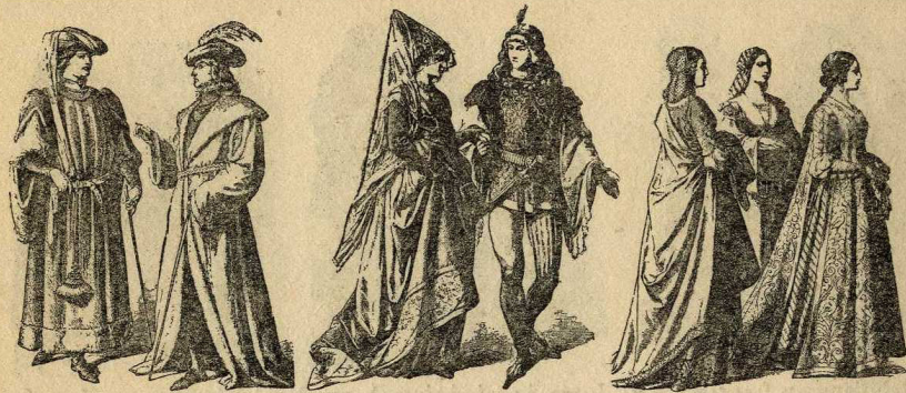
Nobles francesos, xv