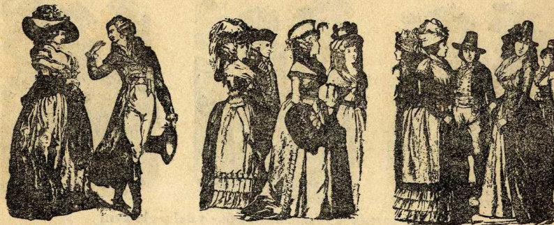
Elegants francesos, s. XVIII