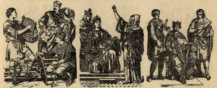
Habillaments carolingis dels segles VIII al IX

Lligats al cos, fent de cinturó, uns cordons de seda o llana, o d'un fi trenat de tires de cuir dorades, donaven dues vegades la volta al cos per sota el pit i per sobre les caderes, caient els caps pel davant fins ran de terra.