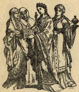
Franceses del s. IX i X