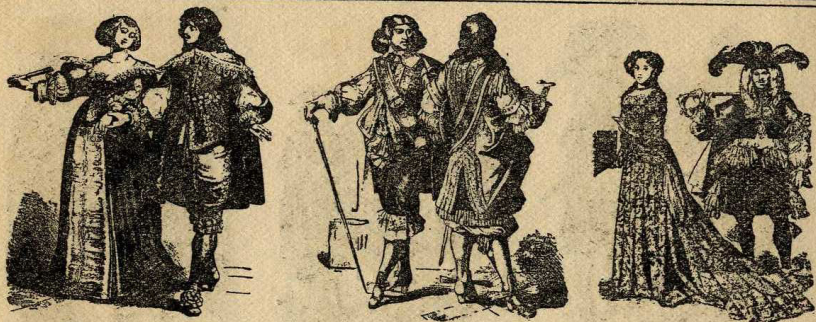
Habillaments francesos de finals del xvii