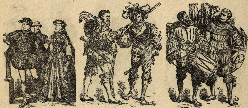
Carles IX i sa esposa Lansquenets : arcabucer, llancer, tambor i banderer, xvi

pesses caient de l'espatlla sobre el braç, a voltes formades per diverses pessas superposades com les valones dels cotxers.