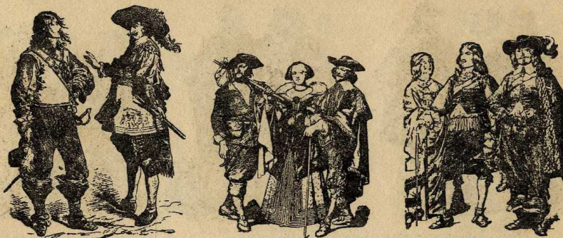
Anglès i flamenc, s. XVII