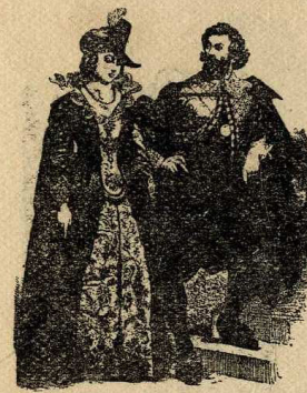
Habillaments anglesos, XVII