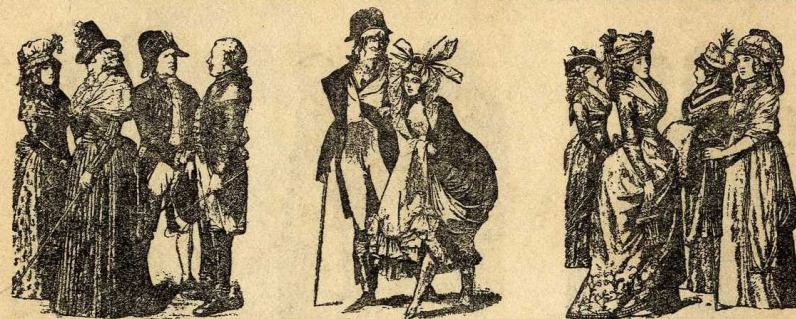
Modes de finals del XVIII