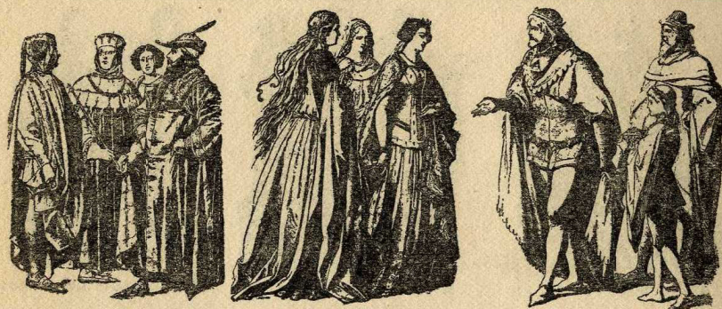
Italianos del s. XIV Dames de la cort anglesa, XIV Príncep i cavaller, XIV

amb gran riquesa de perles i brodats. El coll dret fou una innovació del segle XIV, i es posà també a les jaquetes.