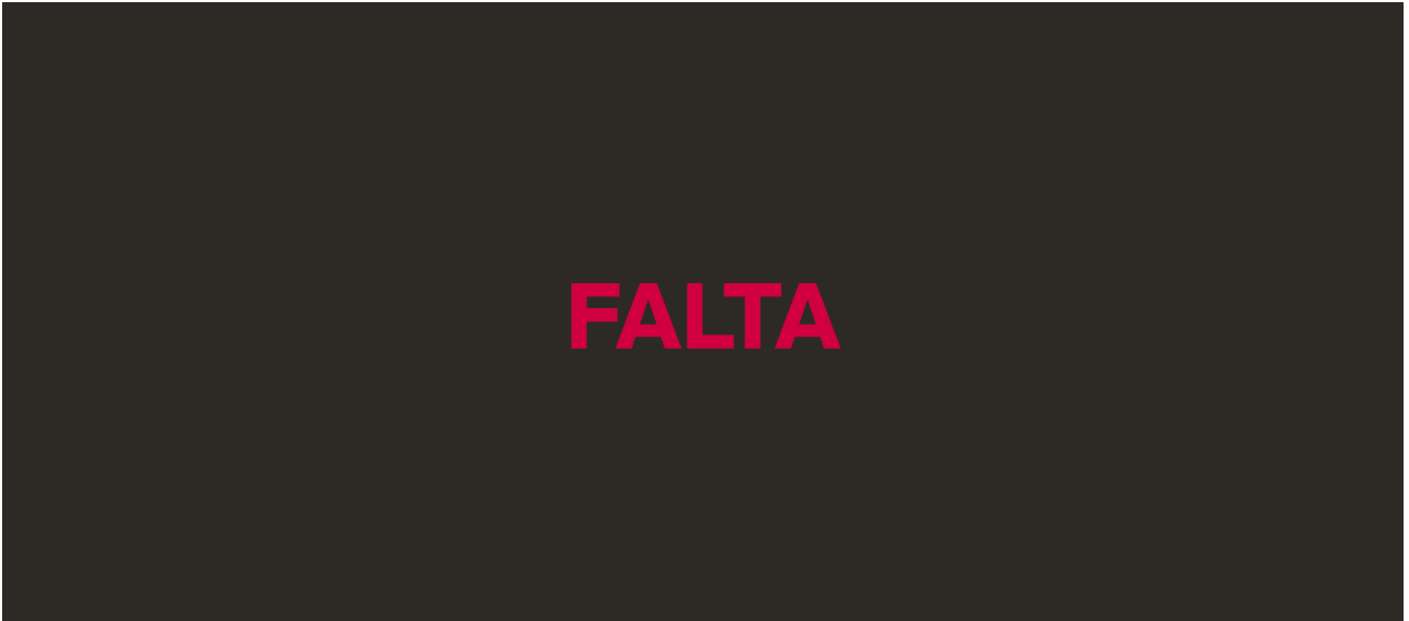
Figura 2. Sistema de Clasificación