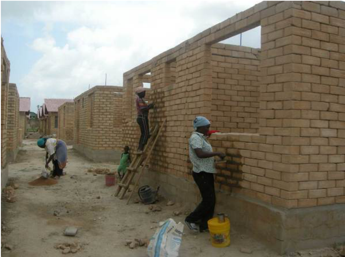
Mujeres formadas por el Programa de Vivienda Comunitaria de Chamazi (Tanzania)

Un mapa recoge proyectos transformadores de todo el planeta en materia energética, de agua y vivienda e incluye a seis iniciativas del Estado español.