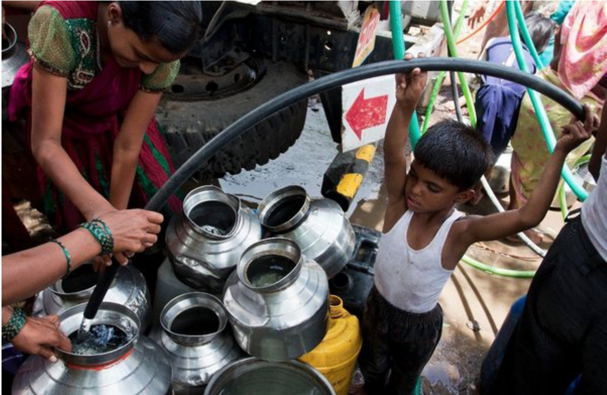
La campaña popular del Comité por el Derecho al Agua (Pani Haq Samti) en Bombay, India